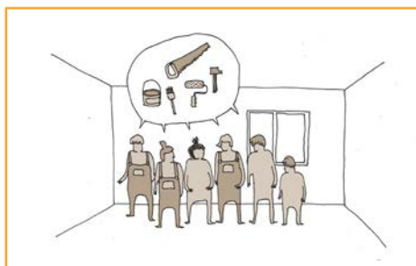
Elaboration du projet avec l'habitant.