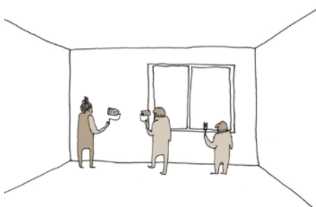
Poursuite en autonomie avec les outils et conseils des Compagnons.