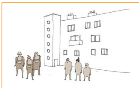
Prise de contact.

Depuis 2014, les Compagnons-Bâtitisseurs sont présents à Narbonne.